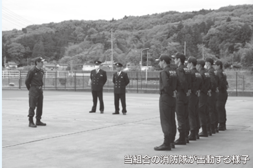
当組合の消防隊が出動する様子

令和8年4月22日(水)に岩手県大槌町で発生した大規模林野火災により、緊急消防援助隊の出動要請を受け、栃木県大隊の一員として出動しました。活動期間は令和8年4月24日(金)から5月2日(土)までの9日間にわたり、延べ24名の職員が昼夜を問わず建物や山林への延焼防止や警戒などの活動に従事しました。