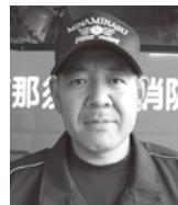
那須烏山消防署 消防司令補