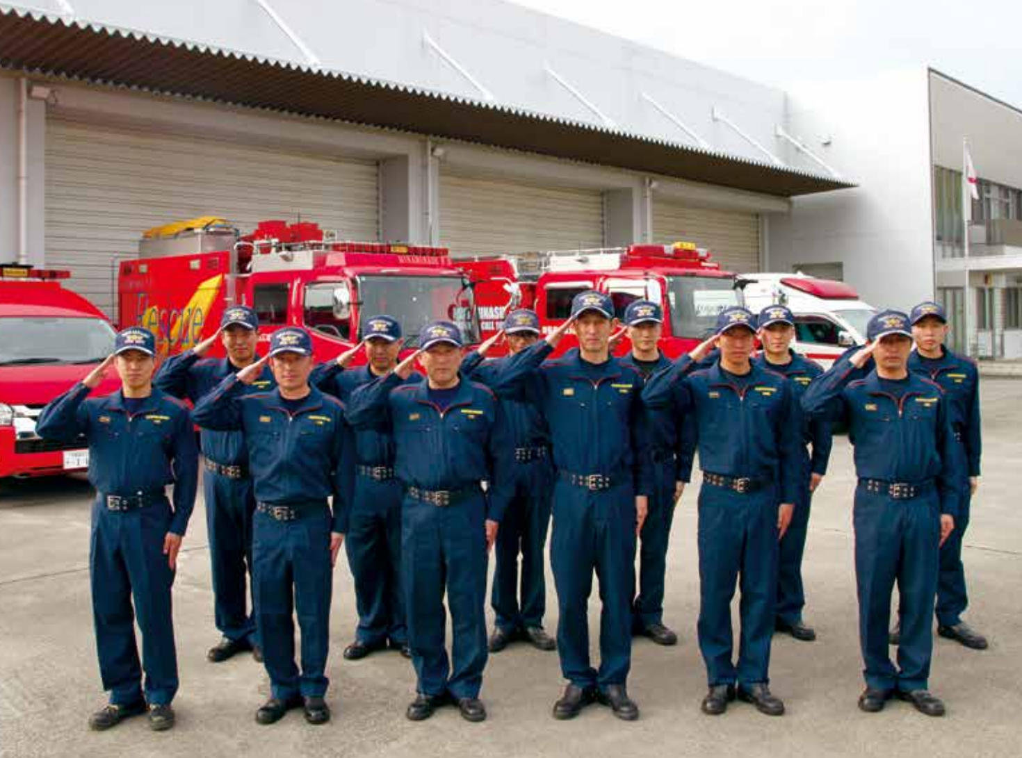
▲令和8年4月1日より導入された新活動服 ※詳しくは当組合ホームページを参照ください。