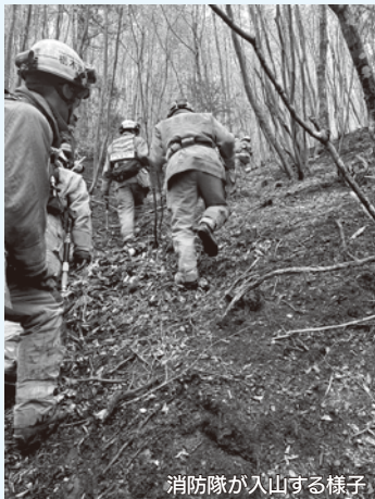
消防隊が入山する様子

令和8年4月22日(水)に岩手県大槌町で発生した大規模林野火災により、緊急消防援助隊の出動要請を受け、栃木県大隊の一員として出動しました。活動期間は令和8年4月24日(金)から5月2日(土)までの9日間にわたり、延べ24名の職員が昼夜を問わず建物や山林への延焼防止や警戒などの活動に従事しました。