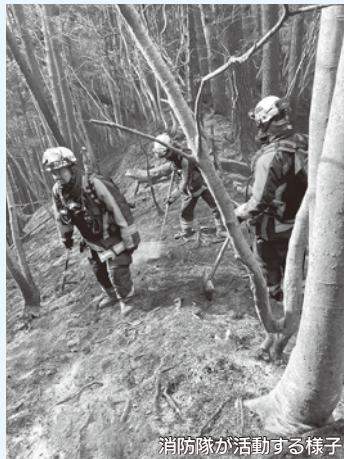
消防隊が活動する様子